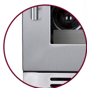
PORTE SANS JOINT