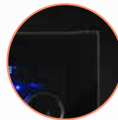
VITRE TEINTÉE SANS CADRE

* La capacités sont approximatives et calculées avec des bouteilles de type bordeaux tradition.